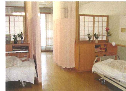
パーティションで仕切った4人部屋