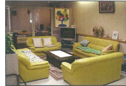
落ち着いた雰囲気のリビー