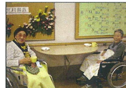
廊下に設置された折りたたみ式の丸テーブルで