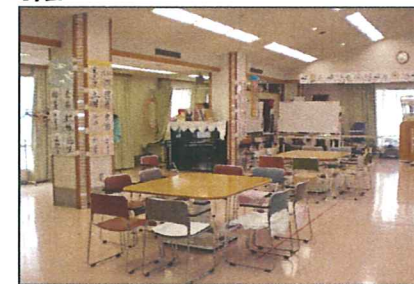
ダイルーム 式典や行事、職員会議等にも使用します。